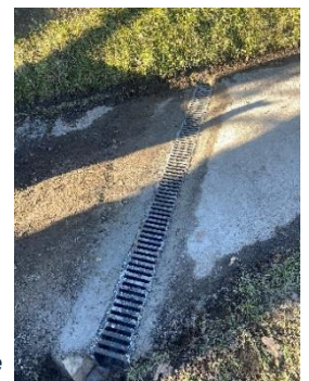
Route de la Fontaine