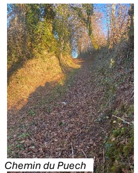
Chemin du Puech